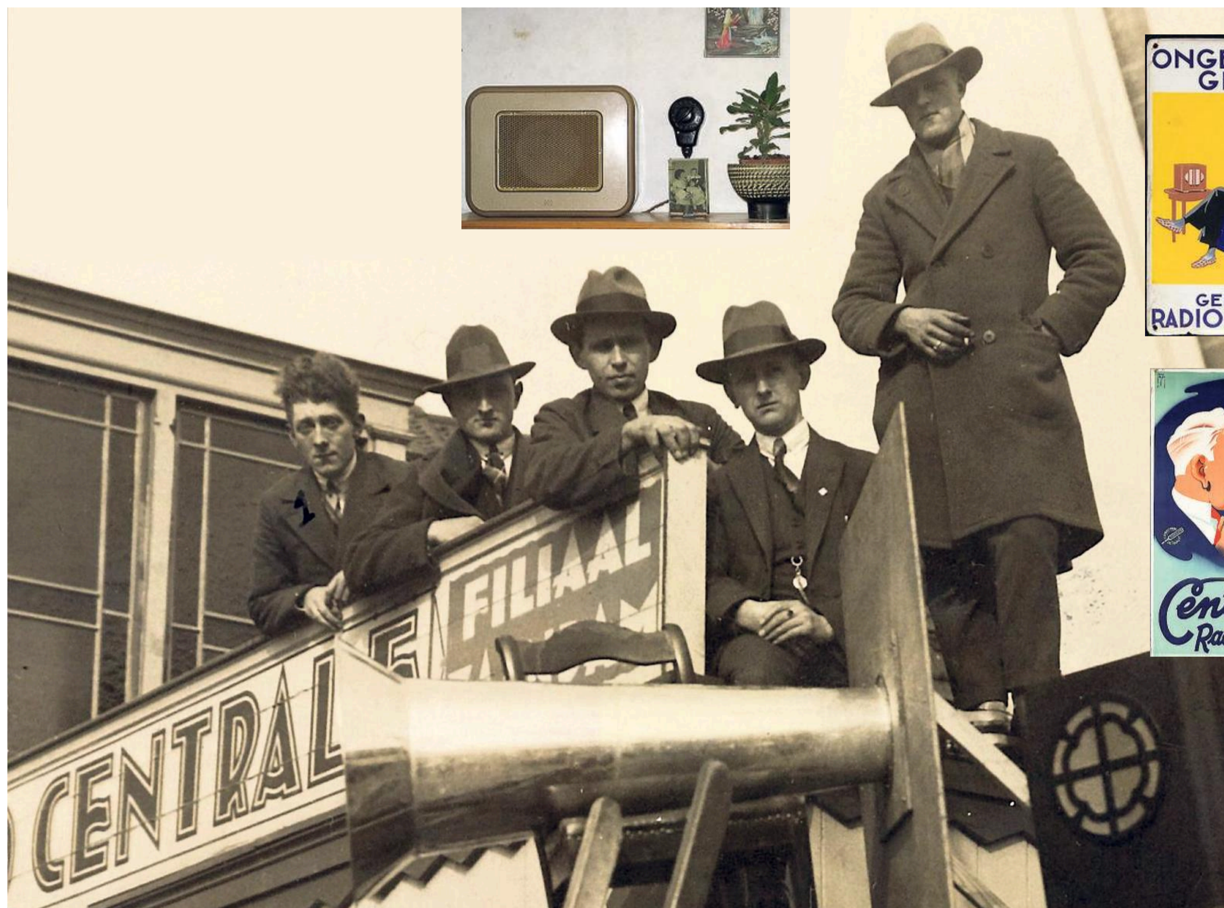
De technische dienst van de Eerste Nederlandsche Radio Centrale in 1930.