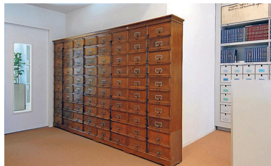
In het Gemeentearchief staat nog altijd deze historische 'Zaalbergkast'. WIM DE JONG

eenheid van documentatie voor alle administratiën der toekomst'. Om te beginnen ging hij het Zaandamse gemeentearchief volgens de universele code ordenen en toegankelijk maken. De archiefstukken werden geordend per onderwerp in houten dossierkasten opgeborgen.