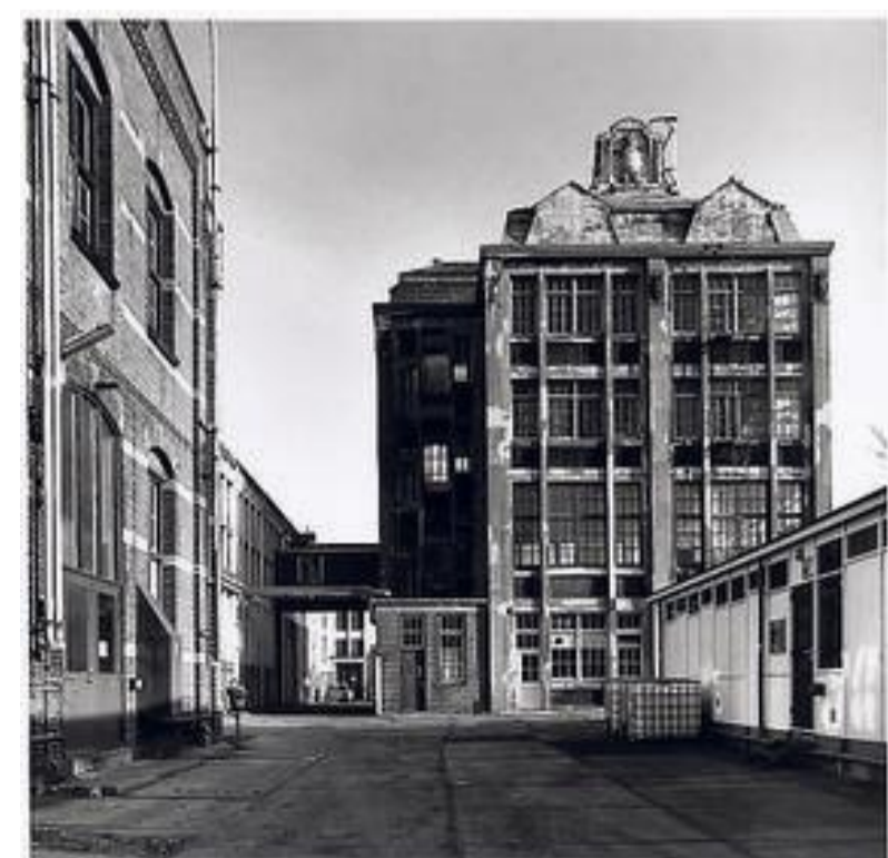
Het fabrieksterrein van Boon in Wormerveer.